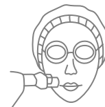
Strong collagen production for the skin and improving open pores of oily skins