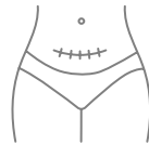
Eliminating the scar, the wound site, and removing pregnancy stretch marks