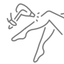
Removal of excess hair from the entire body